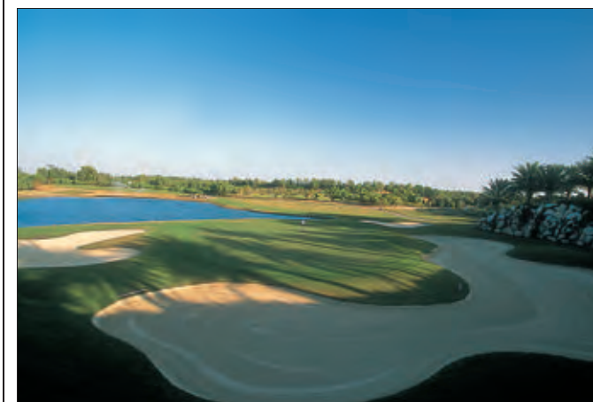
Abou Dhabi (Emirats arabes unis). Quatre parcours très différents y attirent les golfeurs européens en hiver.