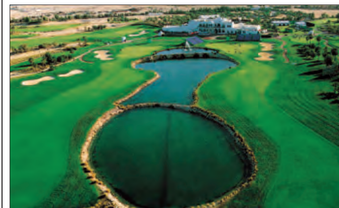
Doha (Qatar). Un parcours de 18 trous et un de 9 trous dans une végétation luxuriante en plein désert.