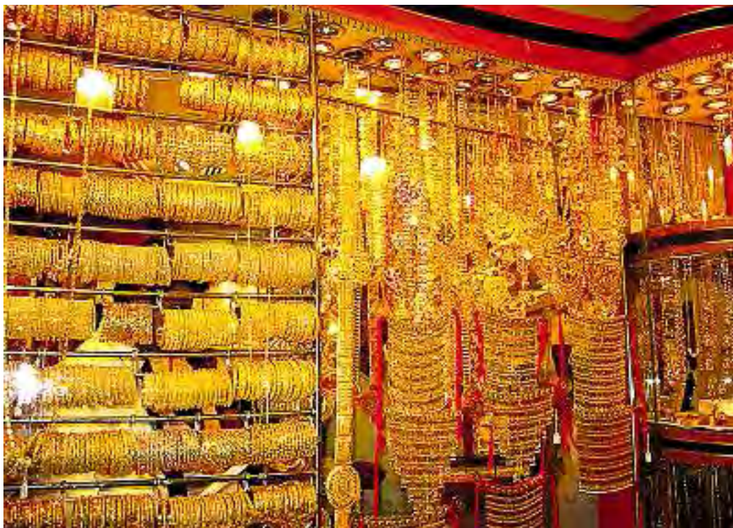
Der Glanz von 1001 Nacht: die Auslage eines Geschäftes im Gold-Souk in Dubais Altstadt.

Goldschmuck in Dubai zu kaufen, ist vor allem aus finanziellen Gründen sehr attraktiv. Die Goldpreise im Emirat gehören zu den niedrigsten der Welt. Dies, und die Vorliebe der Araber für Goldschmuck, hat in der Altstadt einen Gold-Souk entstehen lassen. Gleich neben dem Dubai Creek befindet sich das Viertel, in dem über 300 Juweliere ihren Geschäften nachgehen. In den engen, teilweise sogar überdachten Gassen reiht sich Schaufenster an Schaufenster. Jede Auslage quillt über: Gold – gelb, weiss und rosé – kombiniert mit Brillanten, Smaragden, Saphiren, Rubinen ... alles, was das Herz eines Schmuckliebhabers begehrt. Das Angebot ist riesig und die Palette breit gefächert. Goldschmuck im arabischen Stil überwiegt, doch in