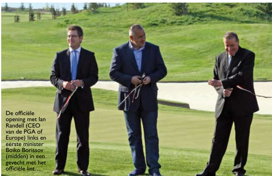
De officiële opening met Ian Randell (CEO van de PGA of Europe) links en eerste minister Boiko Borisov (midden) in een gevecht met het officiële lint...