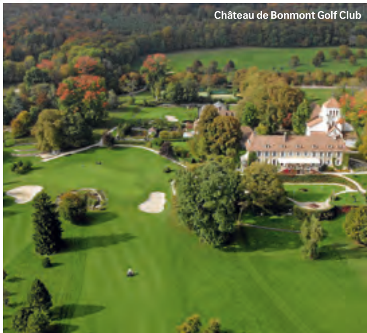
Château de Bonmont Golf Club