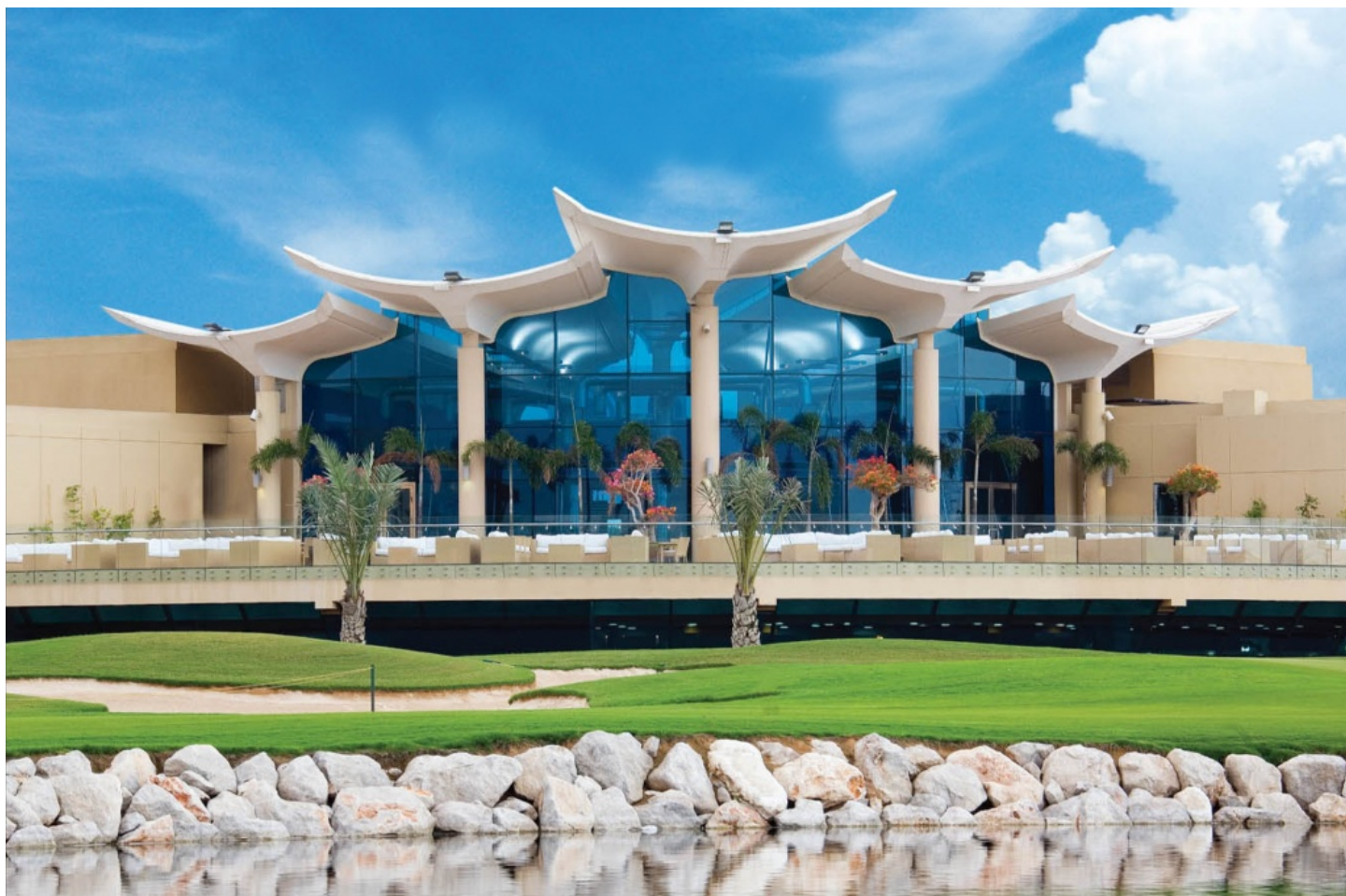
Sharjah Golf & Shooting Club. European Senior Tour