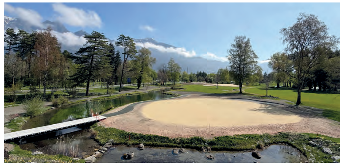
Sämtliche Greens auf dem Parcours wurden von Grund auf erneuert, wie hier Green 11.

des Bestandes für kommende Generationen zu gewährleisten. In den vergangenen acht Jahren wurden insgesamt 80 Jungbäume von der 9-Loch-Anlage Heidiland sowie 100 weitere Jungbäume auf dem 18-Loch-Platz umgesetzt. «Der Transfer der Bäume vom Heidiland auf den 18-Loch-Platz war eine Win-