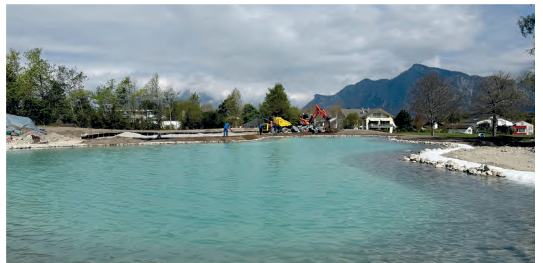
Der neue See auf dem «Signature Hole», der Spielbahn 12, wurde im April mit Wasser gefüllt.