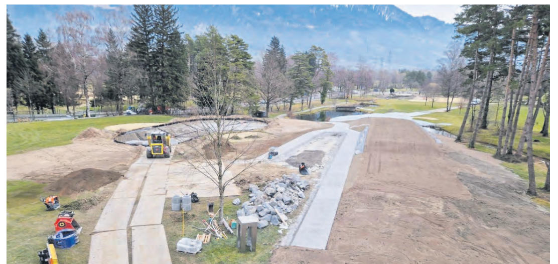
Die Abschlagbox von Loch 9 wurde komplett erneuert und erhöht.